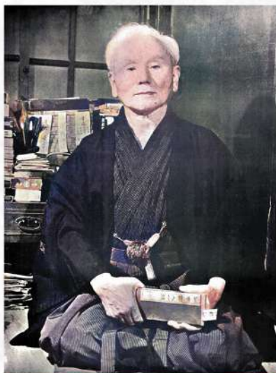
近代空手の父 船越 義珍

船越義珍は1868年11月10日 首里に誕生から154年が経つ。時は江戸から明治維新へと動き新しい時代を迎えた。祖父は尚泰王から家屋敷を戴く俸禄の高い家柄で間もなく廃藩置県によって琉球王国は崩壊し義珍少年11歳一。厳しい武士(サムレー)の家系に育ち二十歳まで片髪(カタカシラ)を結う頑固者だった。