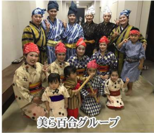
美ら百合グループ