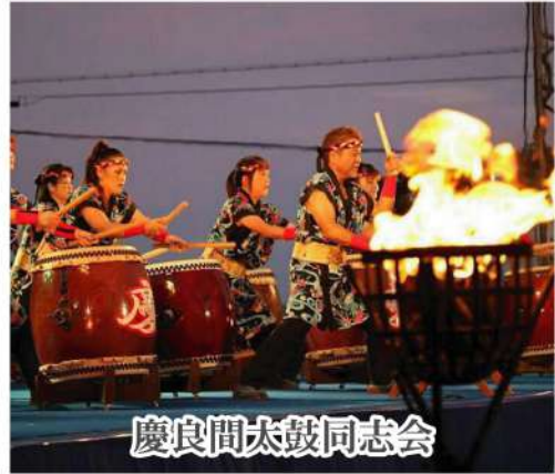
慶良間太鼓同志会