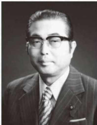
初代沖縄開発庁長官 山中 貞則氏