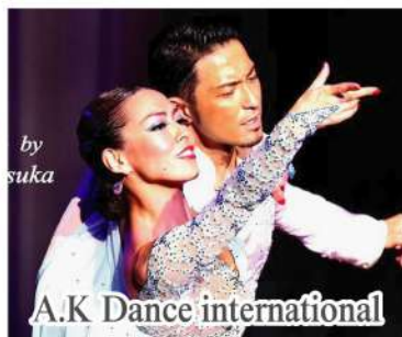
A.K Dance international