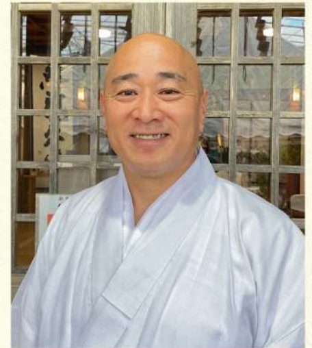
おんしんびょうどう

5回目を迎えた「奥武山大琉球神楽」に新たな企画を加えたこの祈りの祭典を通じて、我々が先人たちから引き継ぐ祈りを次世代へ繋いでいくよう努め、引き続き沖縄から世界平和の祈りを発信し、地球が「元気」になることを願っております。