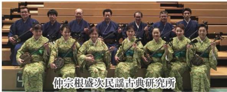
仲宗根盛次民謡古典研究所